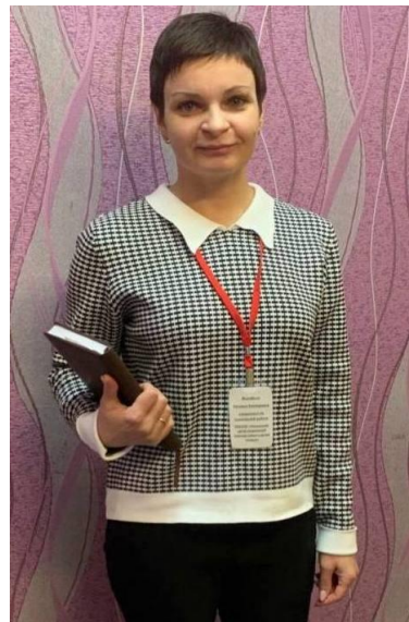
Куратор-наставник (специалист по социальной работе)